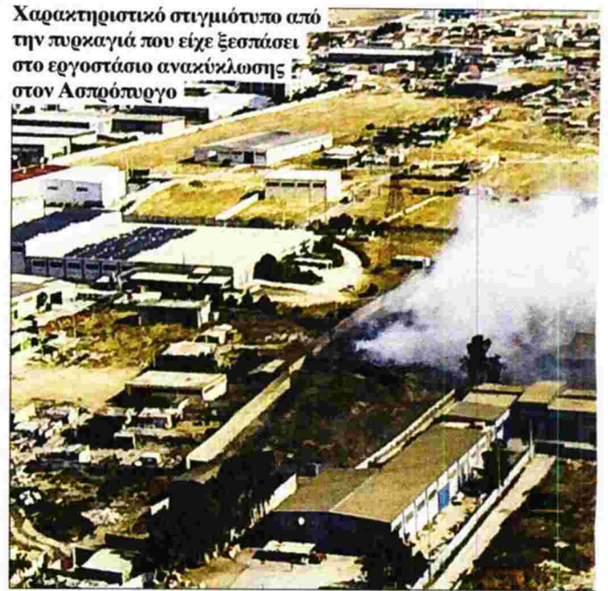
Χαρακτηριστικό στιγμιότυπο από την πυρκαγιά που είχε ξεσπάσει στο εργοστάσιο ανακύκλωσης στον Ασπρόπυργο

ΜΕΤΡΗΣΕΙΣ-ΣΟΚ ΔΕΙΧΝΟΥΝ ΥΨΗΛΟ ΚΙΝΔΥΝΟ ΓΙΑ ΤΗ ΔΗΜΟΣΙΑ ΥΓΕΙΑ!